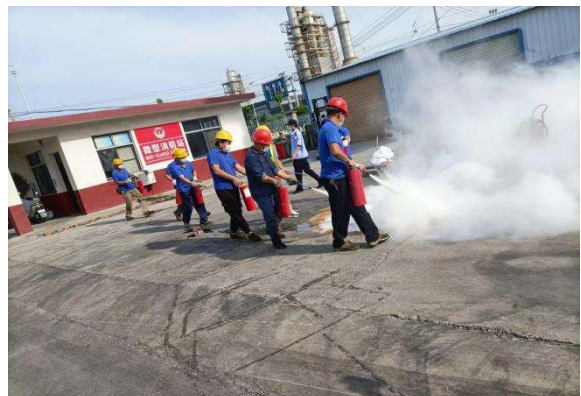
应急救援组从不同方向赶来